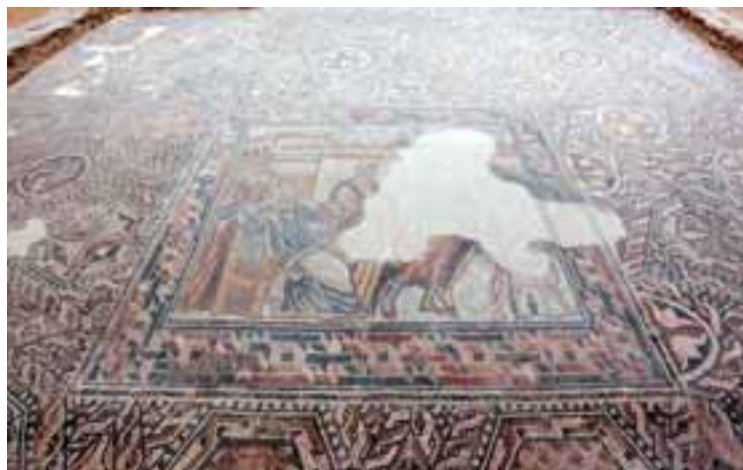
Detalle de uno de los mosaicos, donde la escena principal se rodea de motivos geométricos.

A continuación les condujo al interior de la casa. "Vamos a ver algo muy curioso, una cisterna", adelantó. Pero antes les invitó a hacer un ejercicio de imaginación en el lugar en el que se encontraba el patio de la villa. Porque donde ayer había piedra desnuda en el pasado existían paredes de colores fuertes, como el granate, así como