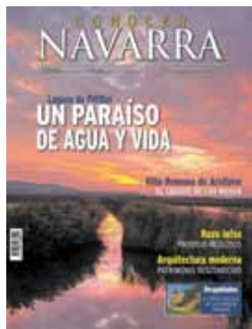
Portada de la revista.

Entre sus contenidos, la revista propone tres excursiones que rescatan los lugares más recónditos de Navarra