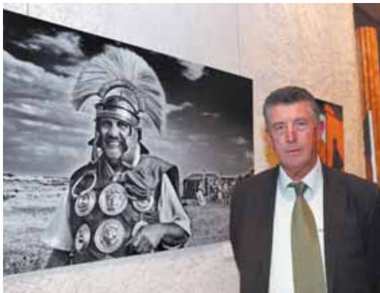
José Torregrosa, autor de la foto ganadora del certamen.