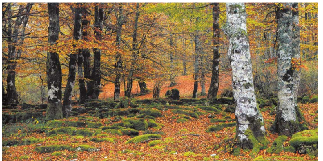
Urbasa "Puntillas de colores alfombran -silencio en musgo, crujiente en hojarasca- el suelo del bosque sobre el que llueven, descuidados y melosos, confetis que las ramas y el viento regalan mientras las copas de los árboles, todas a una, envanecidas en sus almenas, repican susurros en los oídos y siembran la vista de luces y tonalidades". LUIS OTERMIN