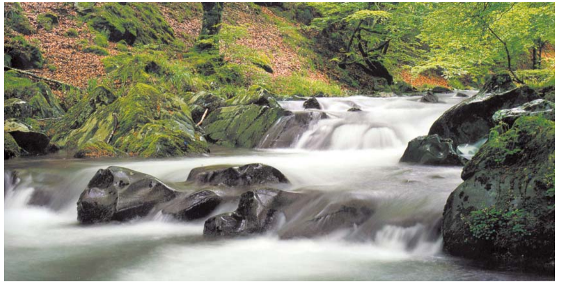
Eugi (Quinto Real) "El agua convertida en un piropo del entorno natural nace corriendo, con prisa, camino del embalse. Sonajero de arrullos, suspiro de perlas, ballet de láminas de espuma, aplauso de colores, ovación de sensaciones, el Arga franquea el bosque derrochando gracia infantil y despeñando, entre pedruscos y piedras, frescura y humedad". LUIS OTERMIN

Puntos de venta: Librerías y grandes superficies