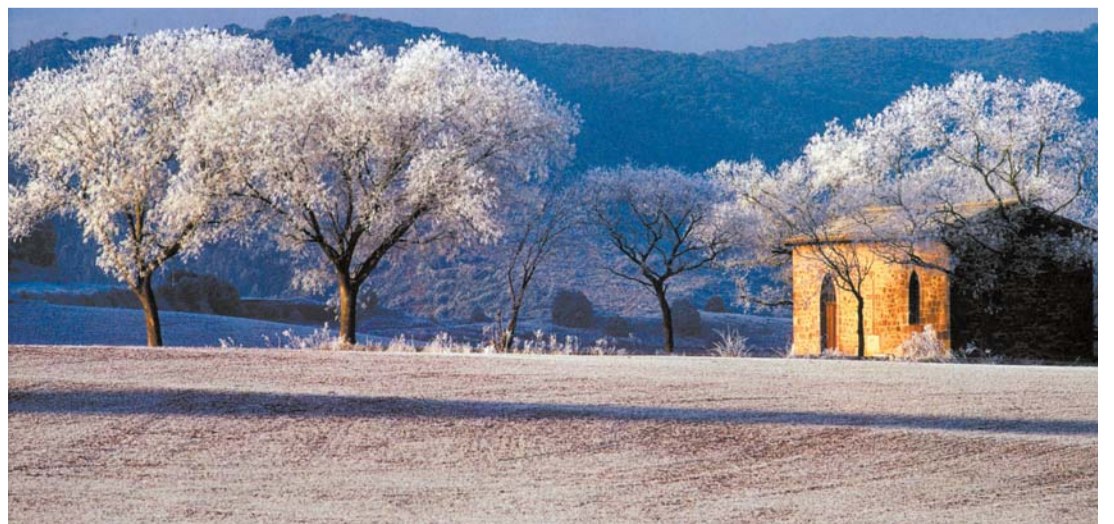
Sorlada "La cencellada, rocío de la noche condensado y congelado, juega a ser acuarelista -que pintar no es esparcir copos sino regalar unas horas de belleza a ramitas entecas por escuálidas y malcaradas y a hierbajos ayunos de miradas y atención-hasta que los rayos iconoclastas del sol devuelvan el entorno al gris, momentáneamente coloreado, invernal". LUIS OTERMIN